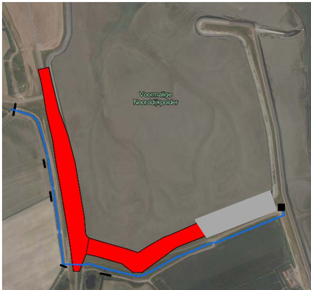
Figuur 2 Oplossingsscenario B: Isoleren watersysteem

Dit alternatief zorgt ervoor dat eventuele verontreiniging zich niet verspreidt naar verder gelegen polders maar gecontroleerd wordt afgevoerd naar de Westerschelde.