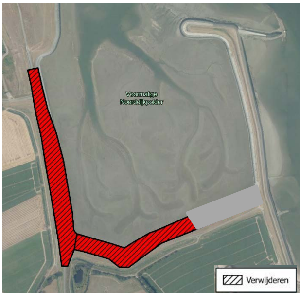
Figuur 4 Oplossingsscenario D: TGG verwijderen

In dit alternatief wordt de kern van de zeedijken bestaande uit TGG geheel vervangen. Dit betekent dat de zeedijken opnieuw moet worden aangelegd en de TGG moet worden afgevoerd naar een stortlocatie. RHDHV bekijkt wat hiervoor moet gebeuren, ook tijdens de aanleg. Bijvoorbeeld in relatie tot het behoud van de tijdelijke hoogwaterveiligheid. Dit kan door bijvoorbeeld tijdelijke damwanden in de bestaande dijk te plaatsen en stapsgewijs te ontgraven en weer aan te vullen.