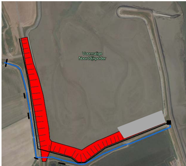
Figuur 3 Oplossingsscenario C: Drainage

Dit alternatief zorgt ervoor dat eventuele verontreiniging eerder wordt afgevangen en gelijktijdig ook de TGG beter wordt ontwaterd. Hiermee wordt de verspreiding richting de kwelsloot direct achter de zeedijken tegengegaan. Deze maatregel kan worden gecombineerd met het isoleren van het watersysteem of losstaand worden uitgevoerd. Bij een losstaande uitvoering wordt er een afvoer van de drainage gerealiseerd richting de Westerschelde.